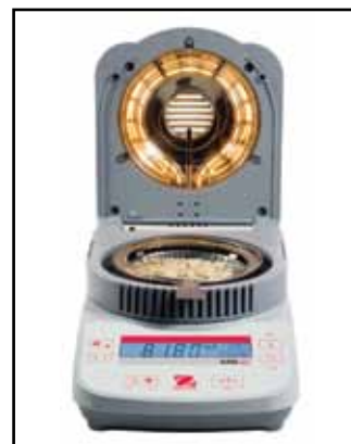
Model OHAUS MB23 se dodává s infračerveným konvenčním ohřevem, dokud MB25 používá halogenovou ohřevu.