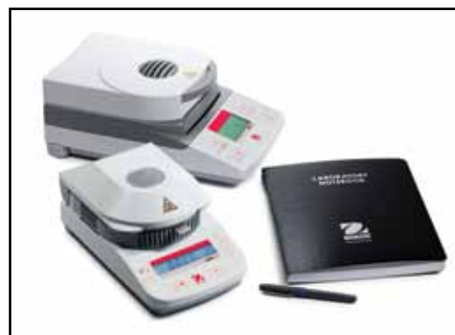
Díky malým rozměrům analyzátoři vlhkosti OHAUS MB23 a MB25 jsou kompaktní a zabírají méně místa v laboratoři.